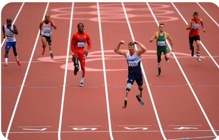
Course d'athlétisme aux Jeux Paralympiques de Londres en 2012

Ils respectent les mêmes règles que les Jeux Olympiques. Pour que la compétition soit équitable, les athlètes doivent affronter d'autres athlètes avec le même handicap. Par exemple, en athlétisme, il y a une épreuve de course pour les aveugles, une épreuve pour les personnes en fauteuil roulant. Lorsqu'on parle des sports pratiqués par des personnes en situation de handicap, on parle de handisport .