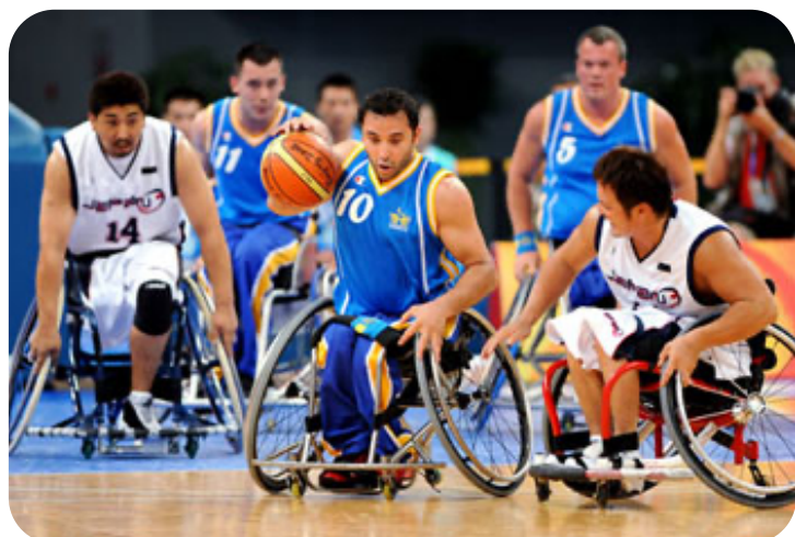
Match de basket Suède / Japon aux Jeux Paralympiques de Beijing en 2008