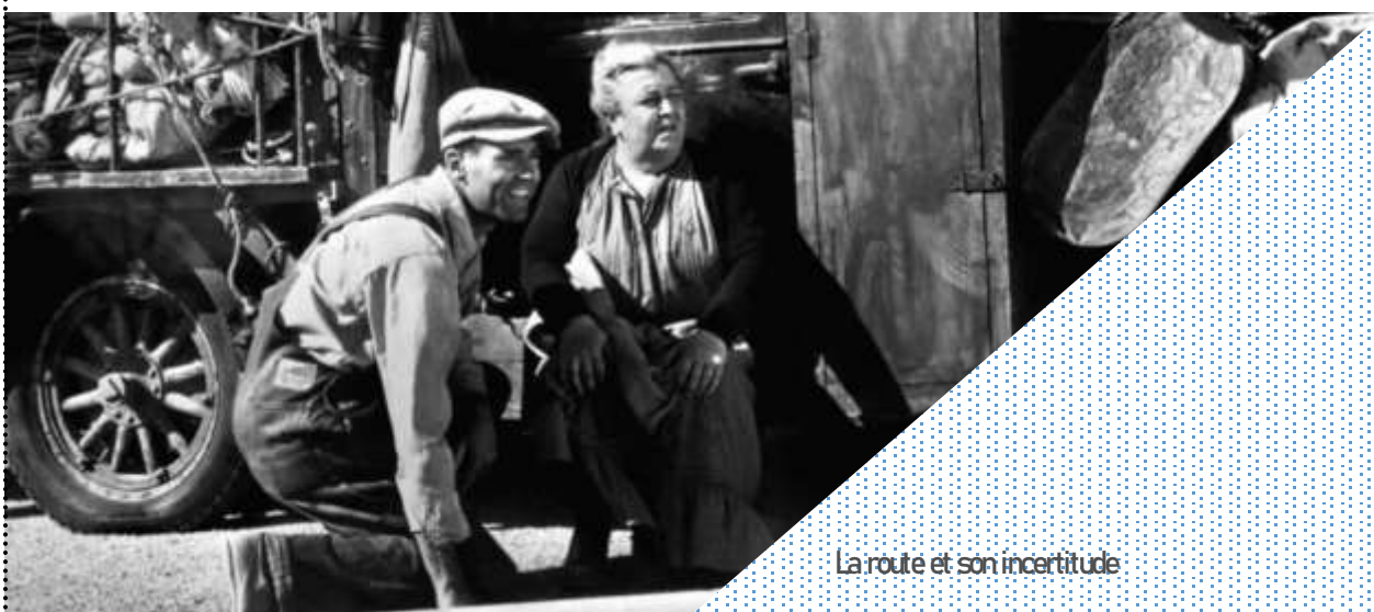
La route et son incertitude

Prenez la route et venez (re)découvrir cette œuvre humaniste et poignante, magnifique adaptation du roman de John Steinbeck et portée par un Henry Fonda incandescent alors au sommet de son art. Un chef-d'œuvre total à voir et à revoir en salle au Festival Lumière !