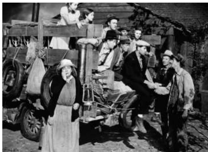
L'exode et l'espoir d'une nouvelle vie pour la famille Joad

Chassés par la crise, les paysans ruinés du centre du pays décident de partir vers l'Ouest et de prendre la route. Ils essayent alors de rejoindre la Californie qui fait figure de véritable terre promise avec ses exploitations de fruits et légumes en manque de main d'œuvre. Au total, il seront plus d'un million à rejoindre la Californie dans les années 1930. C'est ce départ forcé et la recherche d'un nouveau travail pour survivre qui constitue le thème central du film.