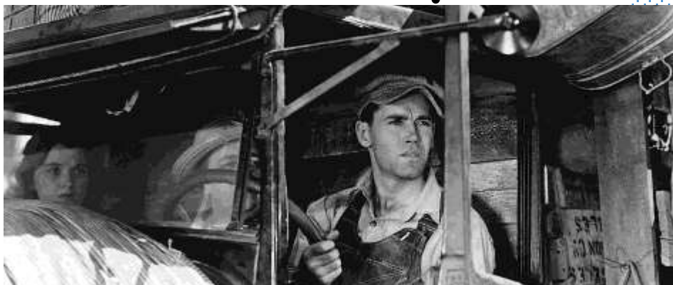
Henry Fonda dans le rôle mythique de Tom Joad

Il révolutionne son art en cassant son image en jouant un personnage véritablement monstrueux pour Sergio Leone dans Il était une fois dans l'ouest (1968). Il apparaît une dernière fois au cinéma en 1981 dans La Maison du lac de Mark Rydell, au côté de sa fille Jane Fonda, et pour lequel il reçoit l'Oscar du meilleur acteur. Il y joue sa propre agonie, se sachant condamné par la maladie, de façon élégante et discrète. Henry Fonda, une silhouette droite, un visage calme et impassible et des yeux bleus clairs, pour un acteur inoubliable.