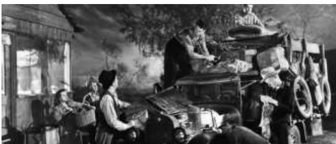
Le sens de la communauté dans le cinéma de John Ford

Au-delà de la différence des sujets abordés, l'approche du réalisateur est toujours ancrée dans une forme d'idéalisme familial et chaleureux. C'est ainsi naturellement que le producteur Darryl F. Zanuck, de la 20th Century Fox, fait appel à lui pour adapter le roman de John Steinbeck, Les Raisins de la colère , dont il vient d'acquiescer les droits pour 75 000 dollars une semaine après sa publication. Le producteur, espérant un succès facile, veut profiter du succès du livre (qui allait bientôt obtenir le Prix Pulitzer) dont les ventes atteignent en 1939 les 2 500 exemplaires par jour.