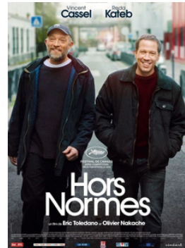
Hors normes, 2019