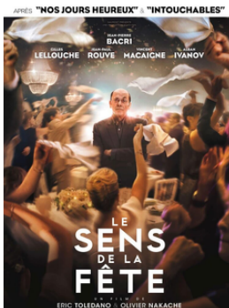
Le sens de la fête, 2017