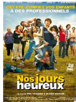
Nos jours heureux, 2010