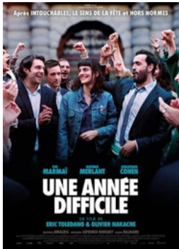
Une année difficile, 2023