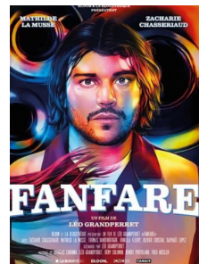
Fanfare , 2021